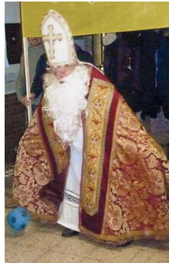
Der Nikolaus und sein Engel im Kgv. „Hohenhorst“: St. Nikolaus macht alles mit! Fußballfan St. Nikolaus hält jeden Ball.

ton. Jetzt wusste fast jeder, der die Gartenanlage besuchte, welcher Plan hinter dieser Baustelle steckte.