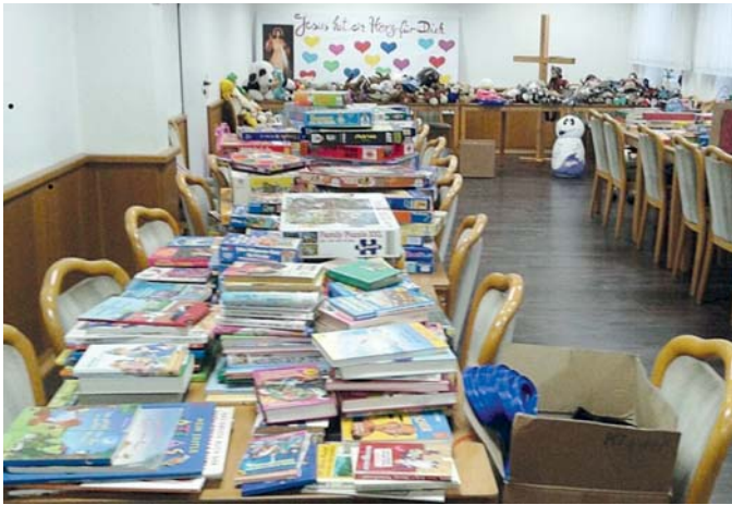
Der Kgv. „Spredey“ sorgte im Dezember für volle Gabentische bei der Tafel in Rauxel.