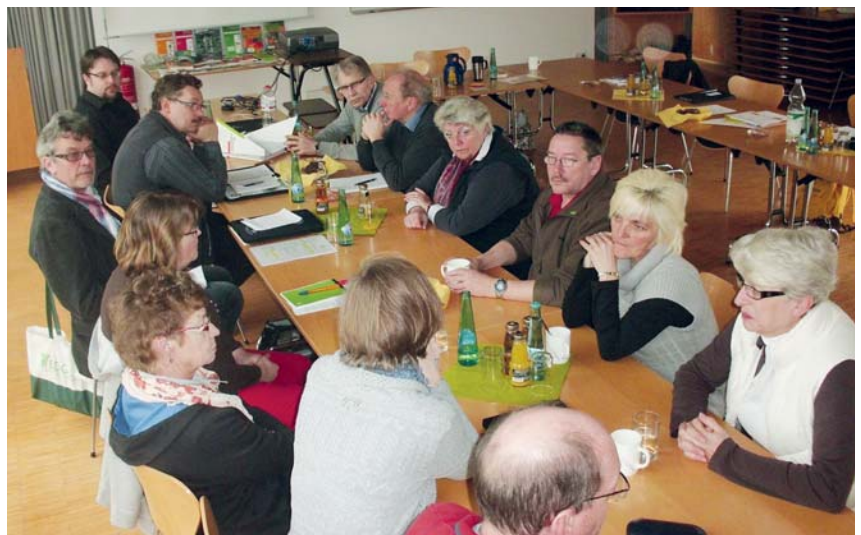
Kinder- und Jugendprojekte bekannt machen, Ideen und Erfahrungen austauschen – das ist ein wesentliches Ziel der 1. Netzwerktagung der Schreberfreunde NRW.