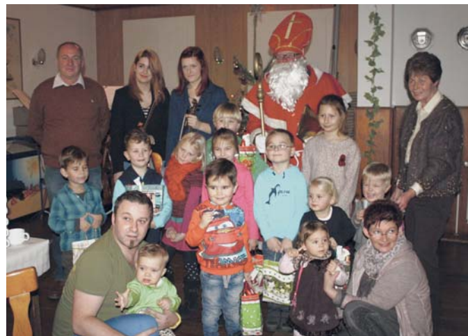
Adventliche Feier mit Nikolaus im Kgv. „Nordenheide“.