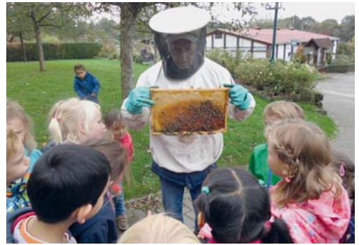
Die Kinder der Kita „Schutzengel“ interessierten sich für die Arbeit der Vereinsimker. Natürlich durften alle später noch vom Honig kosten.