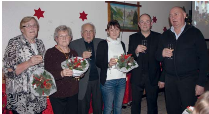
Nach der Ehrung stellten sich die Jubilare des Kgv. „Zum Luttergarten“ Gütersloh mit dem Vorsitzenden für ein Gruppenfoto auf.

Ein großes Lob ging an die Frauengruppe, die wie jedes Jahr den Saal