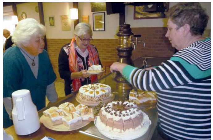
Der Vorstand des Kgv. „Hohenhorst“ lud zum Neujahrsempfang ein: Selbstgebackenes für die Mitglieder!