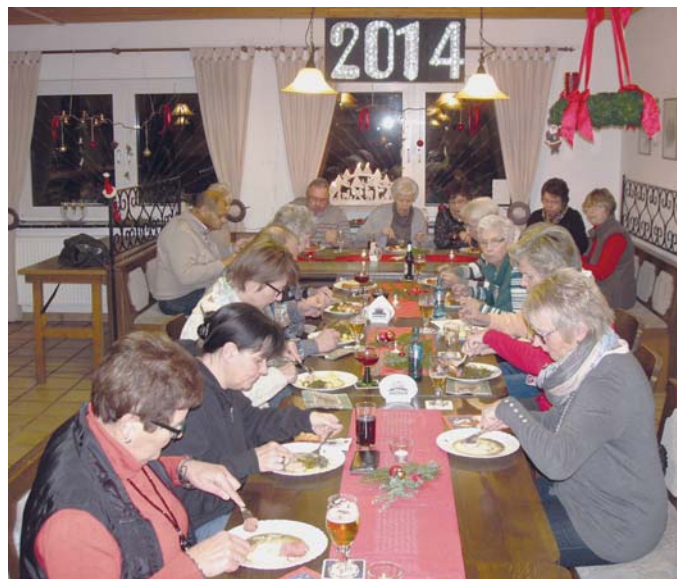
Zum Grünkohlessen als Dank für ehrenamtlichen Einsatz hatte der Vorstand des Kgv. „Am Oelpfad“ eingeladen.

Alle Mitglieder, die in einem Jahr einen runden Geburtstag oder ein Jubiläum hatten, wurden im folgen-