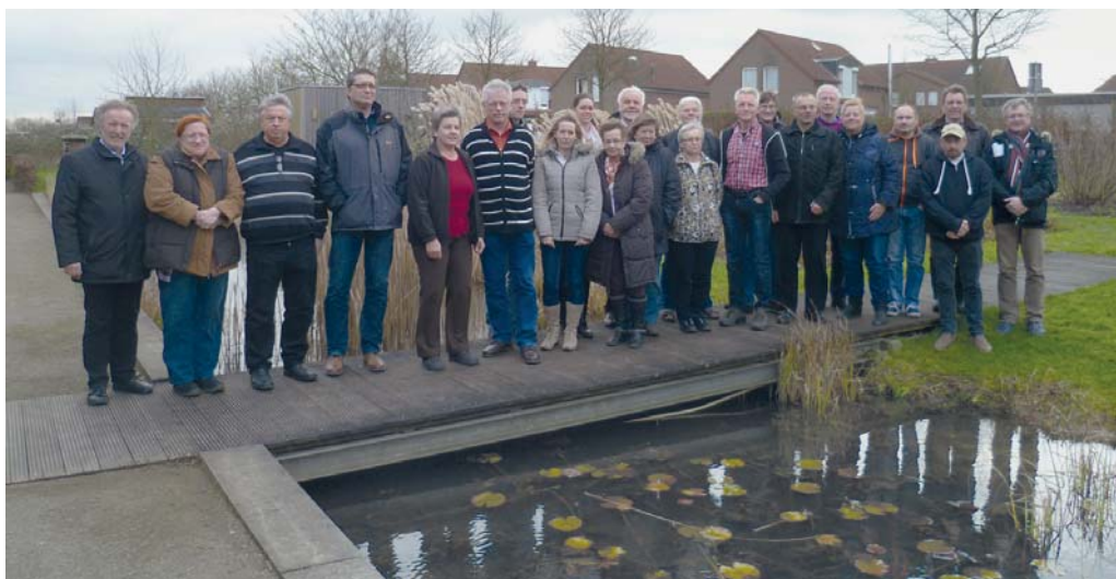
Viel Erfolg wünschen wir den neuen Wertermittlern.