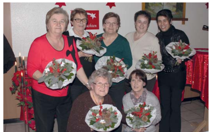
Ein Dankeschön gab es auch für die Frauengruppe des Kgv. „Zum Luttergarten“.