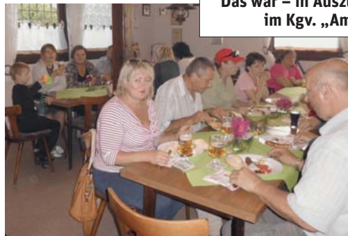
Im August konnten wir eine große Besucherschar aus Belarus (Weiß-Russland) bei uns als Gäste willkommen heißen.