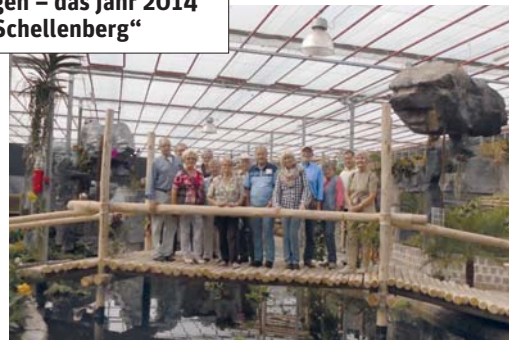
September: Schulungsfahrt nach Emsbüren mit Besuch der EMSFLOWER-Ausstellung – Ein toller Tag!

Der Tanz in den Mai führte wieder einmal Jung und Alt zusammen. Anfang Juni wurde bei guter Beteiligung der „Tag des Gartens“ gefeiert.