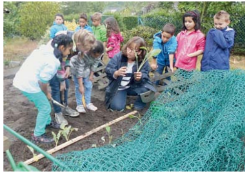
Schüler der GGS Wilhelmstraße bereiteten unter fachkundiger Anleitung ihre Beete vor. Anschließend wurden Kartoffeln und junge Gemüseplänzchen in den Boden gesetzt.

Ein Kaleidoskop des Jahres 2014 Das vergangene Jahr war geprägt von vielen unterschiedlichen Veranstaltungen und Ereignissen.