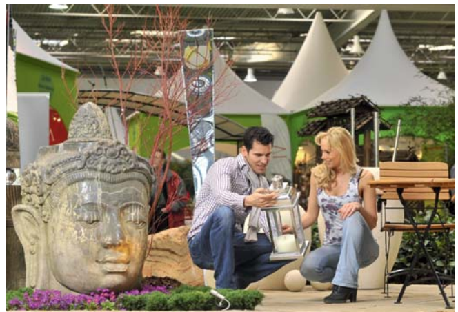
Die B.I.G. widmet sich schwerpunktmäßig dem Thema Garten und bietet Nützliches wie Schönes für jeden Gartenfreund.

Des Weiteren ist eine weitere Schau zum Thema Grillen geplant. Und im Gartenforum NDR 1 Niedersachsen stehen täglich wechselnde und informative Vorträge auf dem Programm.