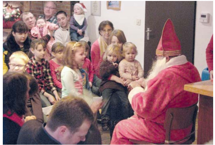
Der Nikolaus verteilte nicht nur Geschenke, er hörte sich auch Gedichte und Lieder von den Kindern des Kgv. „Spredey“ an.

Bei der Tafel angekommen, wurden die Sachen in einem der Räume aufgebaut. Dann kamen die Kinder, um sich etwas von den mitgebrachten Präsenten auszusuchen. Für