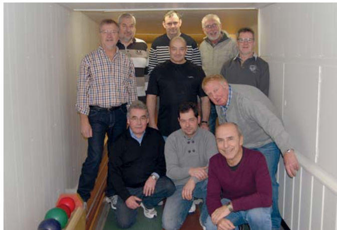
Viel Spaß hatten die Ahsetaler Kegelbrüder am 19. Dezember 2014 bei ihrem alljährlichen Weihnachtskegeln. Seit 24 Jahren pflegen sie nun schon ihr gemeinsames Hobby, das Kegeln.

Aber nein, die „Ahsetaler Kegelbrüder“ hielt es nicht zu Hause in den Sesseln, schließlich war Weihnachtskegeln mit anschließendem Essen angesagt. Das lässt sich kein Kegelfreund entgehen, und wie immer, trotz schlechten Wetters, machten sie sich zu Fuß oder mit dem Fahrrad auf den Weg in die Zunft-